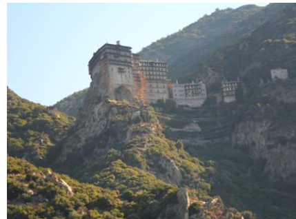
Voyage de notre association au Mont Athos