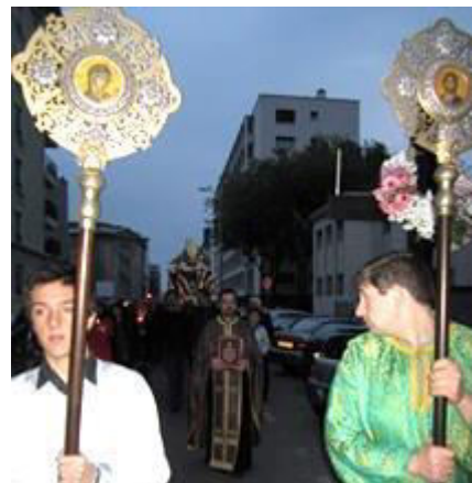
La procession de l'Epitaphios dans notre ville