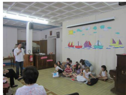
Fête de fin d'année scolaire pour notre école